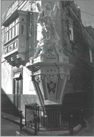
Niċċa ta' Sant'Andrija ta' Wied il-Knejjes, Triq il-Karmnu

triq hemm ukoll statwa ta' San Pawl li qiegħda fuq ċint mal-bejt ta' binja. Niċċa tal-Madonna tal-Karmnu tinsab fi Triq Pawlu Magri, u plakka taħtha tindika li din ingħathat indulgenza fil-5 ta' Frar 1906. Qrib tagħha hemm niċċa oħra ta' San Ġuzepp u l-Bambin Ġesù, bi statwa li għandha valur artistiku.