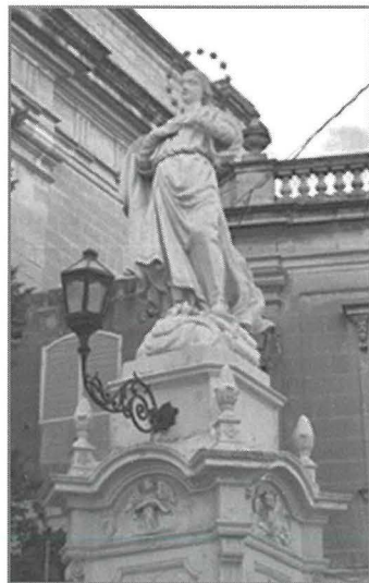
Statwa tal-Immakulata Kuncizzjoni, Misraħ tal-Knisja

F'din il-pjazza nsibu wkoll niċċa ta' Sant'Andrija fuq il-faċċata tal-Palazz Bethsaida, li hija maħduma mill-franka u hija ta' stil pseudo-Barokk. Fil-kantuniera ma' Triq San Ġużep hemm niċċa oħra bi statwa ta' San Ġużep u l-Bambin Ġesù. Din hi mnaqqxa mill-franka u tista' tiġi meqjusa bħala arti poplari. Probabilment, din in-niċċa tat ishimha lit-triq. Meta tinżel ftit 'l isfel f'din it-triq issib ukoll niċċa ta' San Mikiel rebbieħ fuq ix-Xitan, bl-istatwa miżbugħa bil-kulur. Fl-istess triq hemm ukoll niċċa ta' Sant'Andrija, li wkoll għandha statwa miżbugħa u fuqha hemm miktuba s-sena "1865".