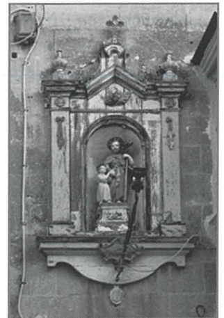
Niċċa ta' San Ġuzepp u l-Bambin Ġesù, Triq ir-Rixtellu

Fi Triq Sant'Andrija, hemm reliev ta' dan il-qaddis fuq il-faccata tal-Palazz Sant'Andrija. Fi Sqaq Nru. 2 tal-istess