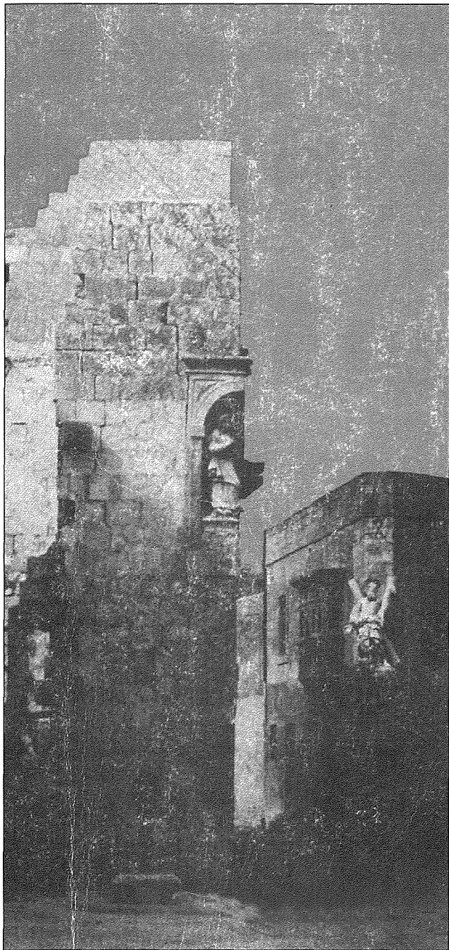
Dehra tal-Istatwa ta' Sant'Andrija fi Triq il-Karmnu fejn bdiet l-ewwel formazzjoni mużikali f'Hal Luqa