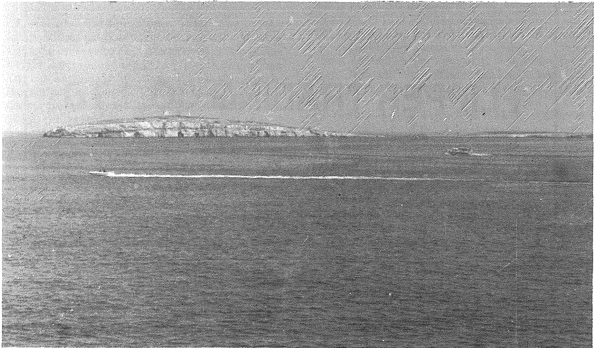
Il-Gżejjer ta' San Pawl

Darba li ġew hawn il-Feniċi f'imħabba l-għadd ta' nixxigħat bħalma huma dawk tal-Mistra, ta' Ghajn Rasul, tas-Safsafa tal-Maħruq u dik li kien hemm f' Xatt il-Lanċa bdew jankraw hawn biex jgħabbu l-ilma waqt li kienu jixtru u jbiegħu. Meta mabgħad huma bnew ir-Rabbat (il-belt tagħhom u dawruwħa bis-swar), fejn huma l-lum ir-Rabat u l-Imdina, billi l-Qawra u id-daħla tal-Gorf (San Pawl il-Baħar) kienu l-egreb portijiet lejn din il-Belt, kien imfittex kemm minnhom, kif ukoll mill-ħakkiema kollha li ġew wara sakemm inbniet il-Belt Valletta.