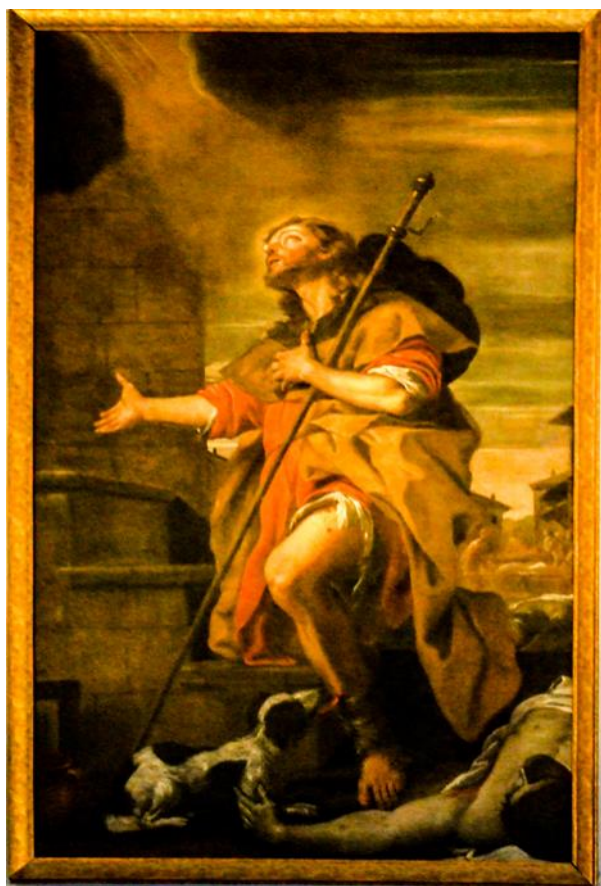
Ritratt 12 — Knisja ta' Sarria, Sant Rokku