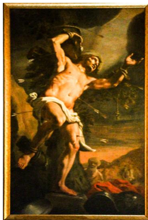
Ritratt 11 — Knisja ta' Sarria, San Sebastjan