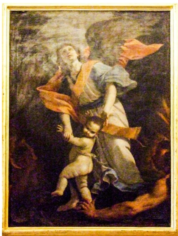
Ritratt 18 — Kappella tal-Madonna tal-Grazzja, Sliema : l-Anglu Kustodju