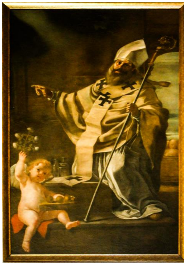
Ritratt 13 — Knisja ta' Sarria, San Nikola