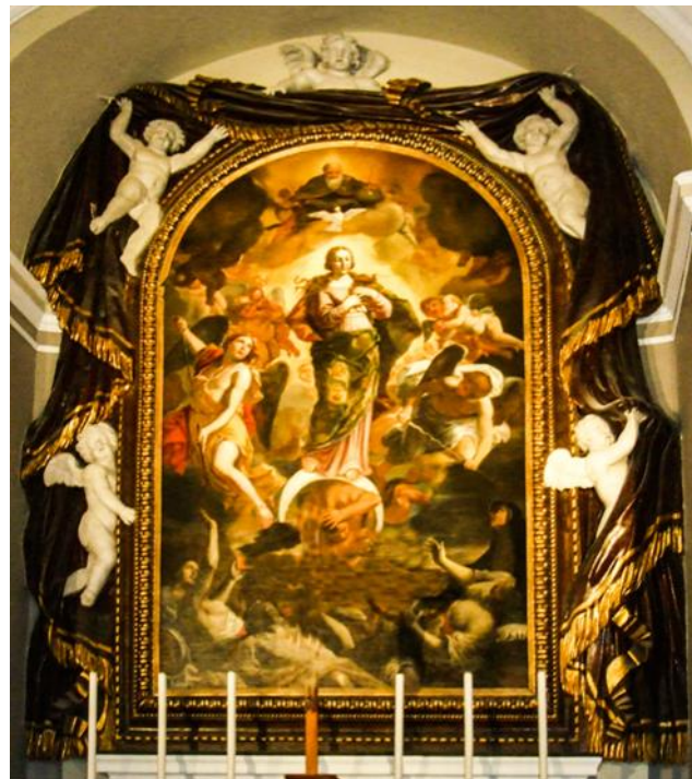
Ritratt 10 — Knisja ta' Sarria, it-titular : l-Immakolata Kunzizzjoni

Dawn il-kwadri kollha li ħarġu mill-pinzell tal-Kavalier Kalabriż ikabbru l-patrimonju għani li nsibu f'dawn il-kappelli u knejjes żgħar.