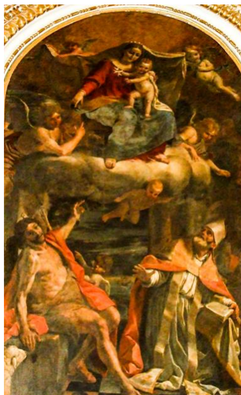
Ritratt 15 — Knisja ta' San Publju, Rabat , titular : il-Madonna bil-Bambin, San Publju u San Ġwann il-Battista