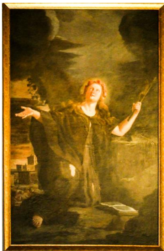
Ritratt 14 — Knisja ta' Sarria, Santa Rosalija