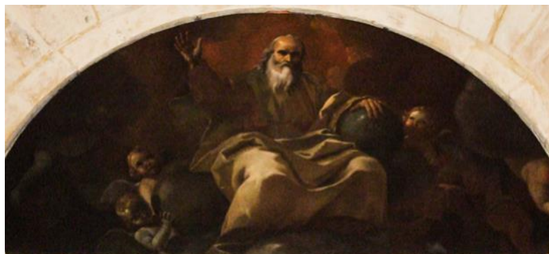
Ritratt 17 — Kappella San Ġwann t'Ghuxa , Bormla, lunett, illum fil-Mużew tal-Arti MUŻA : l-Missier Etern