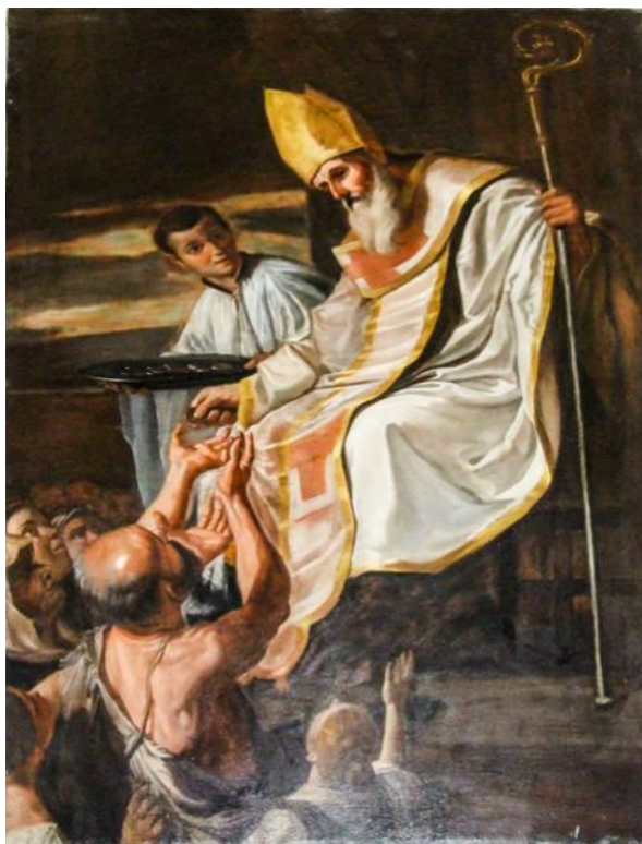
Ritratt 16 — Kappella ta' San Ġwann t'Ghuxa, Bormla, titular_San Ġwann l-Elmożinier