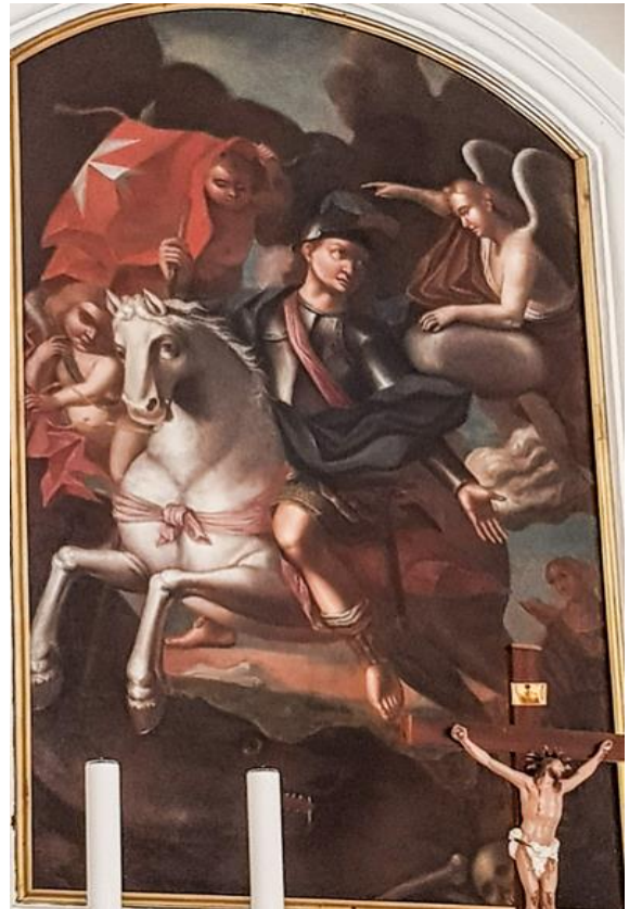
San Ġorġ fuq iż-żiemel abjad joqtol id-dragon