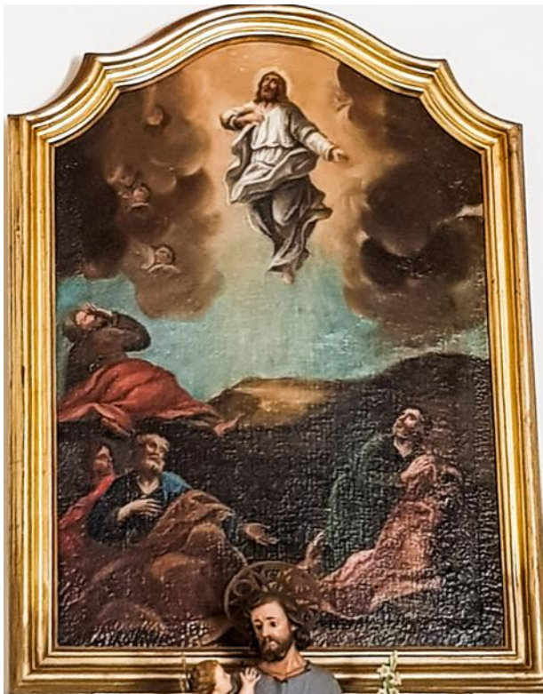
It-trasfigurazzjoni ta' Ġesu