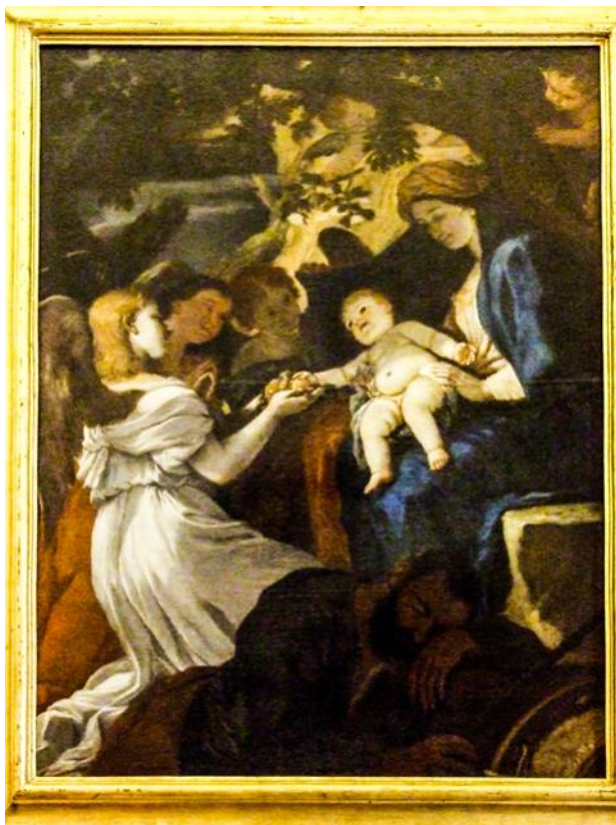
Ritratt 19 — Kappella tal-Madonna tal-Grazzja, Sliema : Waqfa mill-Ħarba lejn l-Eġittu