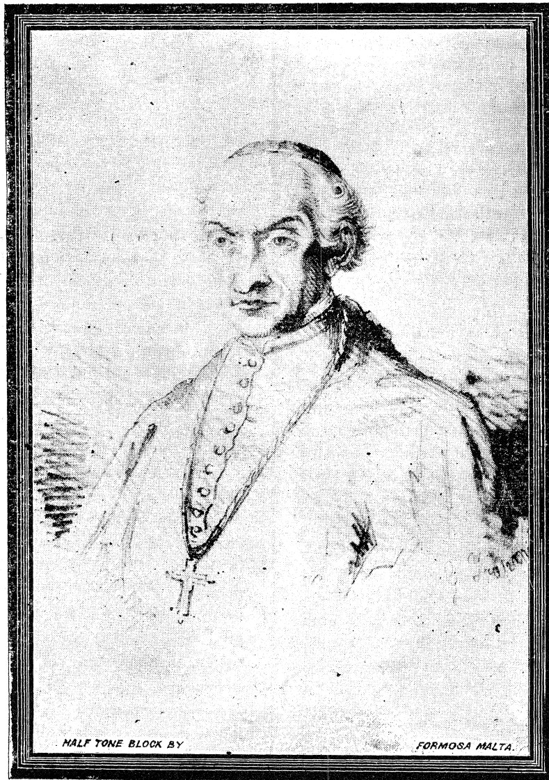
HALF TONE BLOCK BY

feħr jistudjaħ; għalecc il Cardinal XIBERRAS beda biħx ħareħ il fħus minn butu u fetaħ ūieħed ħu. Ūara il għerer ta' Napuljun dac il pajjis chien tħakkar għal collox u chienu geħ imħarħtin il cħejjes u il monasterji collħa. Dana beda biħx fetaħ daħna il monasterji m'il ġdid, u fostħom fetaħ dac ta' s-Sorijiet Benedittini; u billi it-tfal ma cheħħomħ schejjel seħħħa iħjn jitgħallmu, gieħħel lil daħna is-Sorijiet Benedittini biħx jistħu scola għa't-fajliet fkar biħx iħħallmuhom b'ħejn.