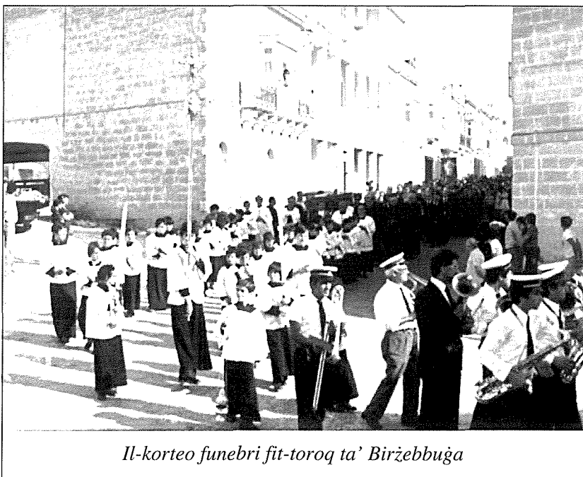
Il-korteo funebri fit-toroq ta' Birżebbuġa