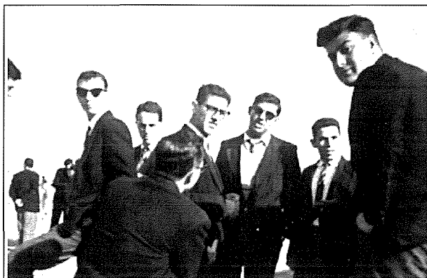
Ma' sħabu s-seminaristi f'mument ta' mistrieħ

Ix-xogħol fil-knisja parrokkjali tkompla wkoll tul il-parrokkat ta' Dun Karm. Tkompla x-xogħol tad-dekorazzjoni fil-koppla li nfethet fl-okkażjoni tal-25 anniversarju mill-proklamazzjoni tad-Domma ta' l-