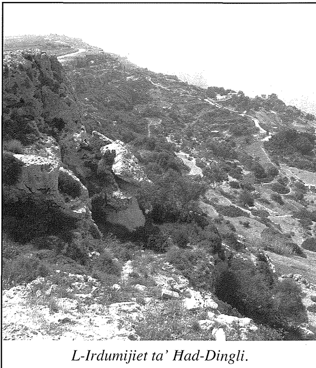
L-Irdumijiet ta' Had-Dingli.

“Mur ohrog u derri ftit”, qattli ommi hekk kif ergajt qgħadt imdejjaq quddiem il-kotba u gergirt minn taht l-ilsien li kelli uġigh ta' ras. Kieku sewwa kienet qieghda tghidli, ghax kont qieghed inhossni ghajjen wisq; imma għaliya ma kienx hemm mistrieh sakemm jghaddi dak l-imbierak ta' eżami li għalih kont infajt b'ruhi u ġismi. Mohhi kien dejjem jahseb, jhewden u jberren. Mal-lejl ftit kont norqod. Kont nohlom fuq l-eżamijiet: swali twal u mudlama, supervisors b'wiċċ imqit, mistoqsijiet twal, idejja iebsa, pinna bla linka. X'fantasija! Mhux ta' xejn matul il-jum kont inhoss rasi tqila. Minn nofs ta' nhar studju, bil-kemm kont qieghed niġbor frott ta' siegħa ghax hafna drabi ghajnejja kienu jingħalqu u l-hsibijiet ta' mohhi kienu jinfirxu għal rashom fi spazju li ma jispiċċa qatt ta' holm bla sens. Kont qieghed insibha iebsa u tqila biex nghaqqad hsieb ma' iehor. Bil-fors li kont ghajjen hafna. Forsi ommi kellha raġun.