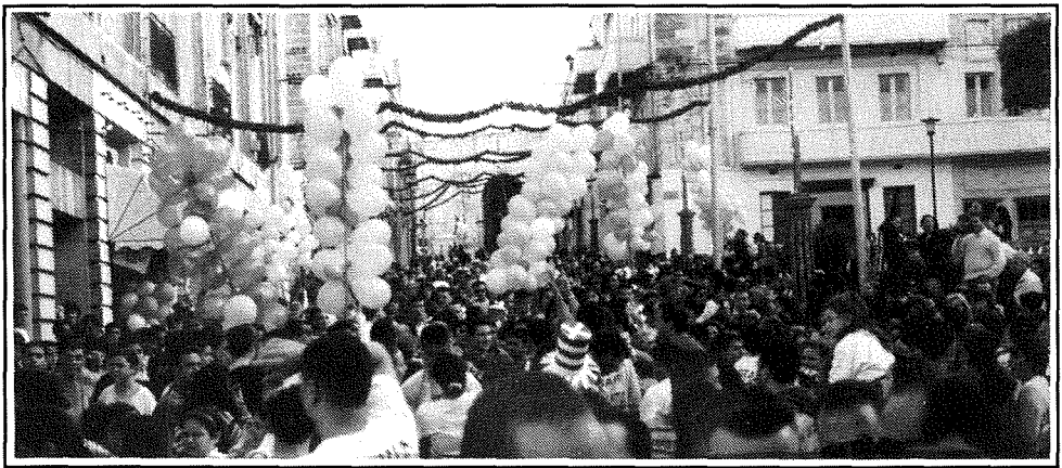
Il-Marċ tas-1.00pm nbar il-Festa tal-Kunċizzjoni.

renju ta' żewġ reġiet Ewropej, Lwiġi XIV ta' Franza (1638-1715) li għalkemm kien despotiku u jhobb il-gwerer, kien iħobb ukoll il-letteratura u l-mużika, u Federiku I-Kbir tal-Prussja (1712-1786).