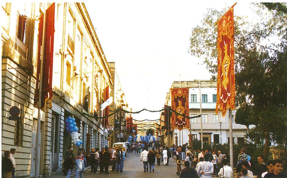
Il-Marċ tas-1.00pm fi Triq il-Ġdida.

L-ewwel tip ta' baned militari beda jidher fis-Seklu 17. L-aktar bikrin kienu matul ir-