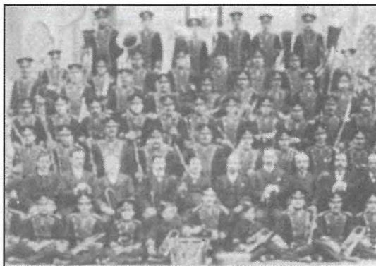
Il-Banda bl-uniformi tax-Xitwa. Ritratt meħud fl-Bidu tas-Seklu Għoxrin.